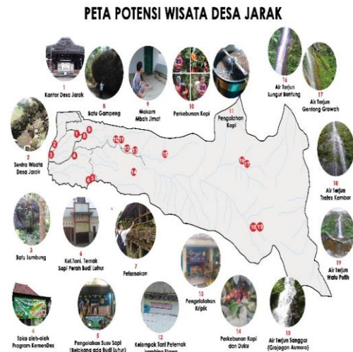
Gambar 2. Pemetaan Geografis Potensi Wisata Desa Jarak

Selain sebagai pekebun, sebagian besar warga Desa Jarak juga bermata pencaharian sebagai peternak. Mayoritas warga Dusun Anjasmoro beternak sapi sedangkan warga Dusun Jarak Tegal beternak kambing PE (Peranakan Etawa). Kualitas susu hasil ternak sapi dari Dusun Anjasmoro tidak perlu diragukan karena telah dipercaya sebagai pemasok utama pabrik susu Nestle, 5.000lt/2 hari.