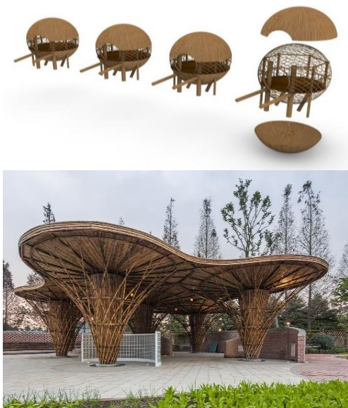
Gambar 3. Usulan Desain Bangunan Sentra Wisata Desa Jarak