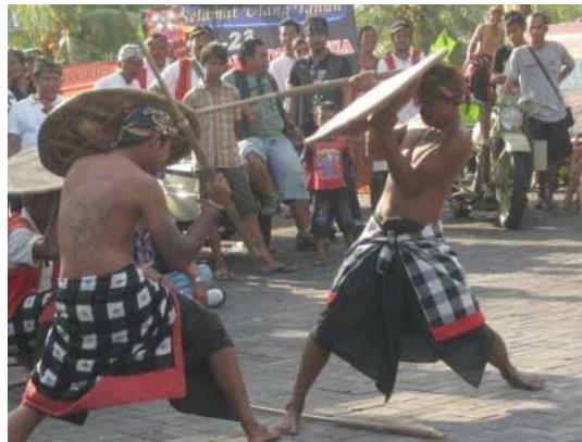
Gambar 7. Tarian Gebug Ende