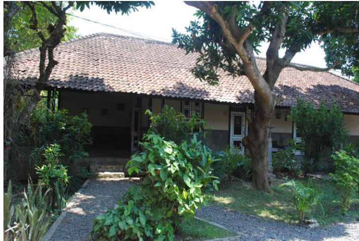
Gambar 2. Bangunan yang difungsikan sebagai kantor pada saat Raja Karangasem bekerjasama dengan Belanda Sumber: Penulis, 2014

bangunan tersebut merupakan bangunan yang paling sering dikunjungi oleh wisatawan, khususnya wisatawan mancanegara.