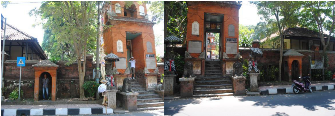
Gambar 1. Pintu Masuk Puri dan Salah Satu Pos Penjagaan