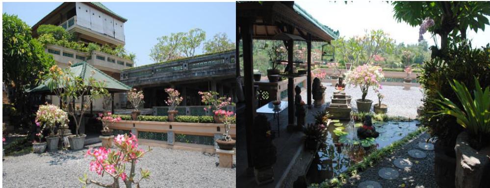
Gambar 5. Rencana penginapan dan restoran