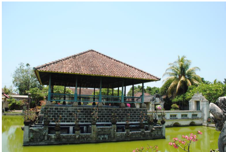
Gambar 4. Bale Kambang

Nama gedong maskerdam diadaptasi dari nama salah satu kota di Belanda yakni Kota Amsterdam. Karena penyebutan “ Amsterdam ” yang cukup sulit bagi orang Bali, maka akhirnya gedong amsterdam diganti namanya menjadi gedong maskerdam . Selain memiliki nama yang unik yang ditujukan sebagai penghargaan terhadap Belanda, ruang ini juga memiliki arsitektur yang unik yakni perpaduan antara kebudayaan Cina, Tiongkok, Eropa dan Bali. Keunikan arsitektur tersebut disebabkan karena pembangunan Puri Agung Karangasem merupakan gabungan dari pemikiran orang Tionghoa, orang Eropa dan orang Bali. Pada konteks ini, meskipun arsiteknya merupakan orang Tionghoa dan Eropa, namun kendali pembangunan puri tetap ada pada raja Karangasem.