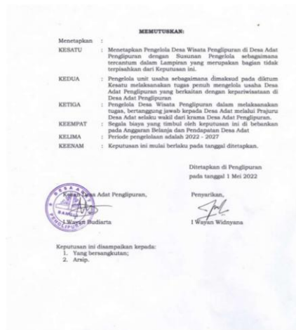
Gambar 24. Keputusan Paruman Desa Adat Penglipuran

Perkembangan Desa Penglipuran menjadi desa wisata tidak terjadi secara instan. Masyarakat awalnya tidak merencanakan pembangunan desa untuk pariwisata, tetapi berkomitmen menjaga adat, arsitektur, dan lingkungan secara kolektif sejak tahun 1980-an hingga 1990-an, yang kemudian menarik perhatian pemerintah daerah sehingga desa ini semakin dikenal sebagai objek wisata budaya yang berkelanjutan. Transformasi sosial ini tercermin dalam penataan ruang desa; kondisi desa yang dahulu tidak tertata rapi berubah secara bertahap melalui semangat gotong royong dan partisipasi warga dalam menjaga nilai lokal, sehingga hasilnya dirasakan bersama sebagai manfaat ekonomi dan kebanggaan sosial (Rachmawati & Fitriyani, 2024).