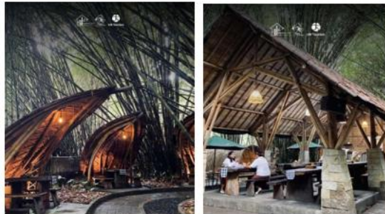
Gambar 27. Bamboo Cafe Desa Penglipuran

Pengembangan potensi hutan bambu sebagai atraksi pendukung pariwisata di Desa Penglipuran, disebutkan bahwa fasilitas seperti bamboo cafe dibangun sebagai bagian dari pendekatan ekowisata yang memadukan aspek lingkungan, sosial budaya, dan ekonomi masyarakat lokal, dengan struktur bangunan berbasis bambu yang ramah lingkungan serta partisipasi warga dalam operasionalnya sehingga “integrasi fasilitas seperti bamboo cafe di tengah kawasan bambu bukan hanya memperluas pengalaman wisata dan memberi nilai tambah ekonomi, tetapi juga mencerminkan penerapan prinsip pariwisata berkelanjutan melalui pemanfaatan sumber daya lokal dan pelestarian alam” (Putra et al., 2025).