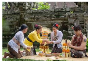
Gambar 17. Aktivitas membuat Gebogan Bunga dan Buah