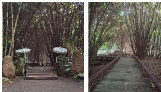
Gambar 26. Hutan Bambu Desa Penglipuran

Hutan bambu di Desa Penglipuran berfungsi sebagai objek wisata dan kawasan konservasi yang strategis karena integrasi fungsi ekologis, budaya, dan sosial ekonomi.