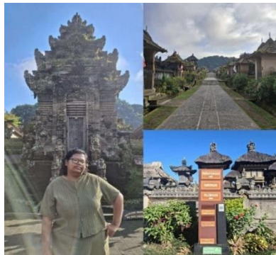
Gambar 5. Konsep Tri Mandala Desa Penglipuran

Desa ini mengikuti konsep Tri Mandala, membagi ruang menjadi parahyangan (pura di utara), pawongan (pemukiman di tengah), dan palemahan (sawah dan kebun di selatan). Pola ini mencerminkan keseimbangan antara aktivitas spiritual, sosial, dan lingkungan.