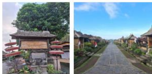
Gambar 1. Desa Penglipuran

Secara historis, Desa Penglipuran diperkirakan telah ada sejak sekitar 700 tahun lalu dan merupakan pecahan dari Desa Bayung Gede di Kintamani. Awalnya wilayah ini digunakan sebagai tempat peristirahatan prajurit kerajaan Bangli sebelum berkembang menjadi permukiman tetap yang dikenal sebagai Desa Kubu Bayung. Seiring waktu, masyarakat membangun struktur adat baru seperti Pura Tri Kayangan dan menata desa berdasarkan konsep tata ruang leluhur sebagai bentuk kesinambungan budaya. Nama Penglipuran sendiri memiliki beberapa makna, seperti “eling pura” (ingat tanah leluhur), “pelipur lara”, serta keterkaitan dengan keberadaan pura di empat penjuru desa yang merefleksikan nilai spiritual masyarakatnya.