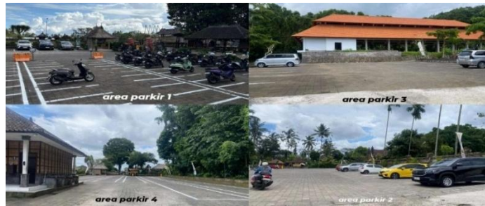
Gambar 4. Area Parkir Desa Penglipuran

Desa Adat Penglipuran memiliki tiga akses pintu masuk yang digunakan oleh wisatawan, yakni pintu di bagian utara, tengah, dan selatan. Akses utara berada dekat dengan area pura desa yang berada di bagian teratas desa. Akses ini dilengkapi area parkir yang cukup luas untuk kendaraan pengunjung. Pintu tengah merupakan titik masuk tanpa area parkir formal sehingga kendaraan biasanya diparkir di sepanjang ruas jalan desa. Pintu selatan juga tidak menyediakan ruang parkir khusus. Rute melalui pintu selatan cenderung menanjak jika pengunjung ingin menyusuri desa menuju utara.