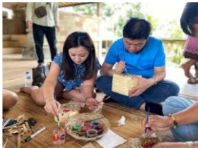
Gambar 15. Aktivitas Melukis Kaben

ruang publik tetap bersih, sehingga kesadaran kolektif warga terhadap kebersihan meningkat dan memperkuat kelestarian lingkungan. Produk wisata Desa Penglipuran, aspek green product menjadi indikator utama yang memengaruhi persepsi keberlanjutan wisata di desa tersebut, dengan hasil bahwa elemen produk, harga, tempat, dan promosi memberikan nilai tambah terhadap daya tarik lokal Penglipuran sebagai destinasi wisata berkelanjutan, khususnya pada penilaian pengunjung terhadap produk umkm dan pengalaman wisata yang ditawarkan secara langsung oleh komunitas desa (Manaj et al., 2025)