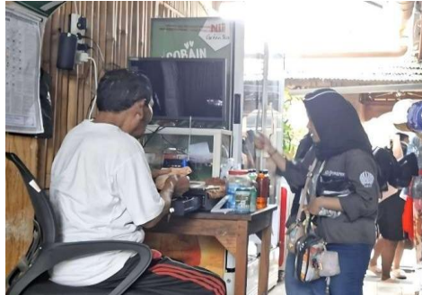
Gambar 30. Pengelolaan Masyarakat Desa Penglipuran

Secara teori CBT, pengelolaan harus dikontrol oleh masyarakat lokal. Di Penglipuran, hal ini sudah sangat sesuai karena tidak didominasi investor luar, adanya sistem berbasis desa adat, dan ada transparansi dan koordinasi rutin.