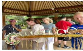
Gambar 21. Aktivitas membuat Penjor