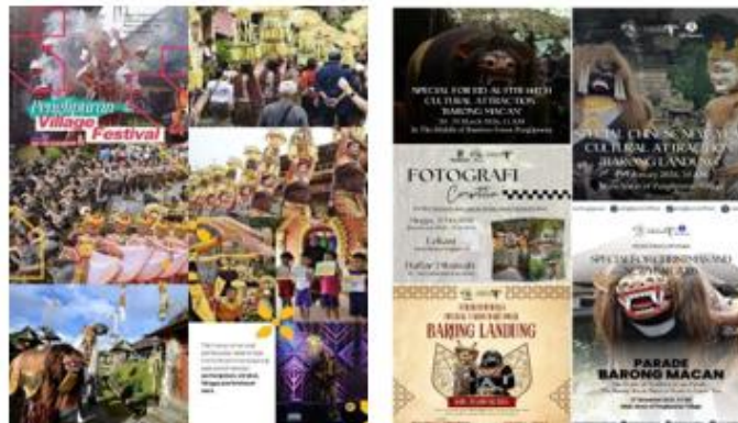
Gambar 11. Penglipuran Village Festival & Atraksi Budaya

Ngusaba bantal ialah upacara tahunan dilaksanakan menjelang Hari Raya Nyepi, ditandai dengan persembahan banten sebagian besar menggunakan jajan bantal, sebagai ungkapan syukur atas hasil panen dan keseimbangan hidup. Upacara ini sarana pelestarian budaya sekaligus atraksi bagi wisatawan untuk menyaksikan kearifan lokal dan kuliner tradisional desa. Adapun Nepak Baan, ritual penghormatan leluhur di mana anggota desa (Krama Ngarep) mengelilingi Bale Agung tiga kali sebagai rasa syukur dan permohonan keselamatan, biasanya bersamaan upacara mlaspas/penyucian bangunan. Hal ini menekankan nilai spiritual, kebersamaan, dan rasa hormat mendalam (Sudarwani & Priyoga, 2023).