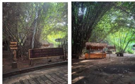
Gambar 28 Pasar Penglipur Lara Desa Penglipuran

Pasar tradisional seperti pasar pelipur lara yang dibuka di tengah kawasan hutan bambu setiap akhir pekan mencerminkan praktik pariwisata berkelanjutan karena menyediakan ruang bagi pelaku UMKM lokal untuk menjual produk kerajinan dan hasil pertanian masyarakat setempat, sekaligus mendorong interaksi langsung antara pengunjung dan komunitas desa, yang menurut studi tentang paradigma green tourism di Penglipuran “Pasar pelipur lara berkembang sebagai ruang transaksi dan interaksi sosial budaya bagi wisatawan dan warga lokal, sekaligus memperkuat ekonomi lokal melalui pemajangan produk khas desa dalam suasana yang ramah lingkungan” (Wisudawati et al., 2025).