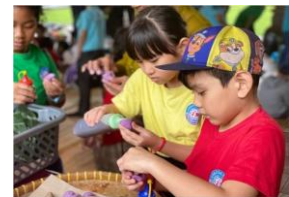
Gambar 18. Aktivitas membuat Kue Klepon