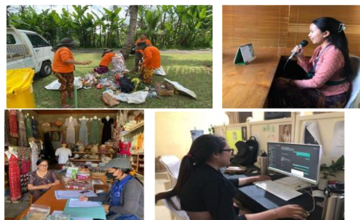
Gambar 23. Lapangan Pekerjaan di Desa Penglipuran

Dari aspek kependudukan, salah satu dokumen mencatat bahwa Desa Adat Penglipuran memiliki sekitar 280 kepala keluarga dengan jumlah penduduk sekitar 1.007 jiwa pada tahun 2025. Data ini memperlihatkan bahwa Penglipuran merupakan komunitas dengan ukuran yang tidak terlalu besar, sehingga relasi sosial antarwarga cenderung dekat dan memungkinkan koordinasi berbasis adat berjalan secara kuat. Dalam konteks penelitian berbasis komunitas, kondisi demografis sangat penting karena memengaruhi pola partisipasi, pengambilan keputusan, dan distribusi manfaat pariwisata.