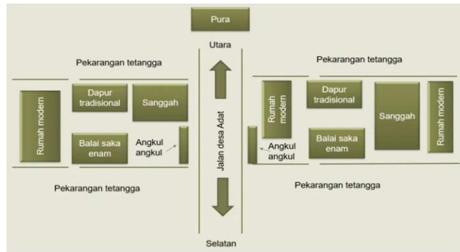
Gambar 6. Tata Ruang Perkarangan