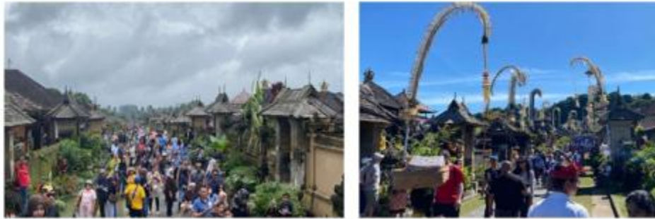
Gambar 33. Carrying Kapasitas Desa Penglipuran

wisata, adanya penurunan kualitas pengalaman wisata dan kerusakan lingkungan yang dikatakan oleh masyarakat lokal “Tanaman rumputnya... akhirnya mati karena diinjak terus” (Wayan, wawancara, 14 April 2026). Hal ini menunjukkan bahwa CBT belum sepenuhnya mampu mengontrol daya dukung lingkungan.