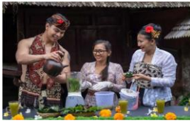
Gambar 19. Aktivitas membuat Loloh Cem – Cem