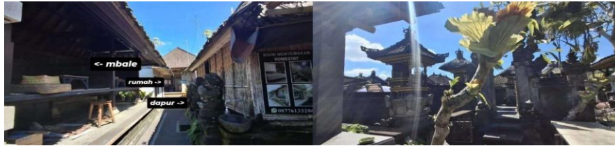
Gambar 8. Penempatan Ruang Desa Penglipuran

Elemen ornamen seperti ukiran dan motif tradisional pada gerbang dan pagar rumah memiliki makna simbolik yang kuat, merefleksikan identitas budaya Bali Aga serta nilai estetika lokal yang terus dipertahankan oleh komunitas penglipuran.