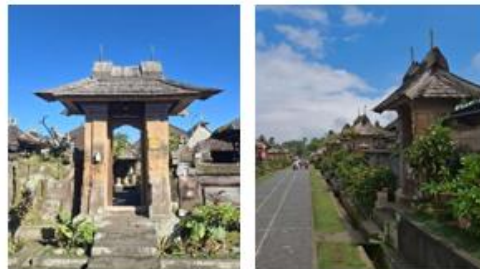
Gambar 9. Angkul - Angkul Desa Penglipuran

Elemen ornamen seperti ukiran dan motif tradisional pada gerbang dan pagar rumah memiliki makna simbolik yang kuat, merefleksikan identitas budaya Bali Aga serta nilai estetika lokal yang terus dipertahankan oleh komunitas penglipuran.