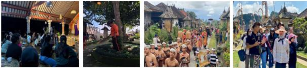
Gambar 29. Partisipasi Masyarakat di Desa Penglipuran

Partisipasi masyarakat di Desa Penglipuran tergolong sangat tinggi dan menjadi fondasi utama dalam pengelolaan pariwisata berbasis komunitas. Masyarakat tidak hanya berperan sebagai objek, tetapi sebagai subjek aktif dalam berbagai kegiatan pariwisata. Berdasarkan hasil wawancara, partisipasi masyarakat diwujudkan dalam keterlibatan dalam rapat desa secara berkala, keterlibatan dalam kegiatan festival dan budaya, gotong royong dalam menjaga lingkungan desa, dan keterlibatan dalam pelayanan wisatawan