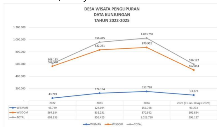
Gambar 31. Dampak Positif Keberadaan Desa Wisata

Implementasi CBT di Desa Penglipuran menunjukkan dampak yang signifikan terhadap perekonomian lokal. Menurut hasil penelitian, “pengembangan desa wisata memberikan dampak positif di bidang ekonomi berupa tumbuhnya peluang usaha, kesempatan kerja, dan peningkatan pendapatan masyarakat setempat” (Nirmala et al., 2024). Selain itu, penelitian lain menemukan bahwa “perkembangan pariwisata mampu meningkatkan pendapatan masyarakat sekitar 150–300 persen dan mendorong terbentuknya peluang usaha baru bagi pelaku UMKM dan sektor jasa seperti homestay dan kuliner” (Prihantara et al., 2025).