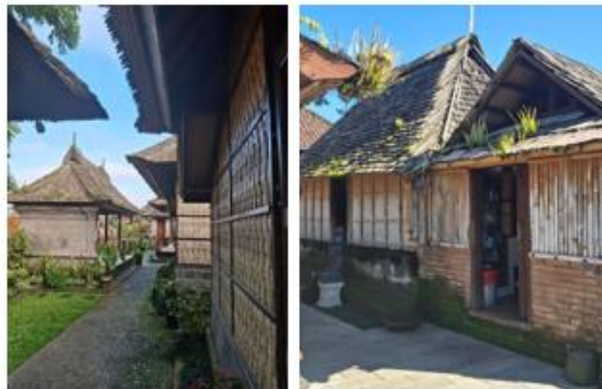
Gambar 7. Bentuk & Material Desa Penglipuran

Rumah tradisional di Desa Penglipuran memiliki bentuk bangunan yang seragam dengan atap dan dinding yang menggunakan bahan dari alam berupa bambu yang dianyam dan alang-alang sebagai penutup atap, mencerminkan prinsip arsitektur vernacular Bali yang berkelanjutan dengan lingkungan alamnya. Material tradisional seperti bambu seringkali digunakan pada struktur utama rumah maupun gapura masuk, sementara dinding alami memberikan tekstur visual kuat yang membedakan arsitektur lokal ini dari bangunan modern.