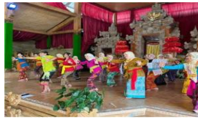
Gambar 20. Aktivitas Belajar Menari