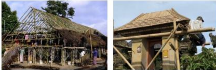
Gambar 13. Pemeliharaan Rumah di Desa Penglipuran

Desa Penglipuran memiliki banjar adat yang berfungsi sebagai forum musyawarah untuk pengambilan keputusan terkait urusan sosial, lingkungan, dan ritual adat, mencerminkan praktik deliberatif yang kuat dalam komunitas.