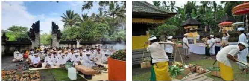
Gambar 10. Ngusaba Bantal, Nepak Baan Desa Penglipuran

Tradisi di Desa Penglipuran mencakup ritual keagamaan, gotong royong, musyawarah adat (awig-awig), dan kebiasaan lokal lainnya. Ritual keagamaan dilaksanakan sesuai kalender adat Bali dan mencerminkan orientasi spiritual komunitas, sedangkan musyawarah adat berfungsi sebagai mekanisme pengambilan keputusan yang menghormati nilai kolektif. Norma kebiasaan berbasis adat ini juga memperkuat ikatan sosial dan identitas komunitas (Sudarwani & Priyoga, 2023).