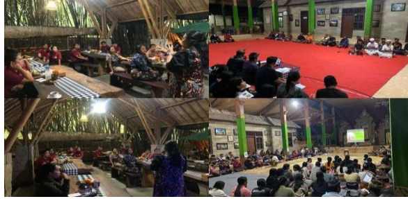
Gambar 12. Banjar Adat di Desa Penglipuran

Desa Penglipuran memiliki banjar adat yang berfungsi sebagai forum musyawarah untuk pengambilan keputusan terkait urusan sosial, lingkungan, dan ritual adat, mencerminkan praktik deliberatif yang kuat dalam komunitas.