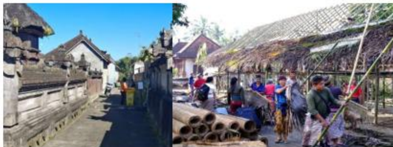
Gambar 14. Gotong Royong & Kebersihan Lingkungan Desa

Susunan ruang rumah, termasuk bangunan suci (merajan), dapur (paon), dan halaman, disusun sesuai aturan adat yang ketat. Pemeliharaan rumah dilakukan secara rutin oleh keluarga, termasuk perbaikan atap, tembok, dan perabotan tradisional, untuk menjaga keaslian arsitektur dan keselarasan estetika desa, sekaligus memastikan penerapan nilai budaya tetap hidup dalam kehidupan sehari-hari (Sudarwani & Priyoga, 2023).