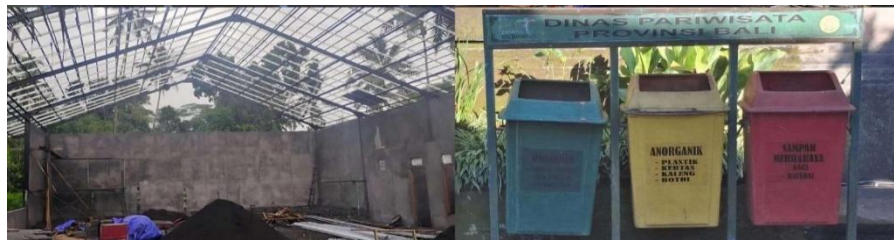
Gambar 25. TPS & Tempat Sampah Desa Penglipuran

Bukti nyata penerapan pariwisata berkelanjutan di Desa Penglipuran terlihat dari partisipasi warga dalam pengelolaan lingkungan seperti pemeliharaan kebersihan dan konservasi sumber daya alam, di mana masyarakat mempraktikkan pemilahan sampah organik dan anorganik meskipun sistem pengolahan lanjutan termasuk fasilitas tempat pembuangan sampah terstandar (TPS 3R) masih dalam tahap pembangunan dan belum tersedia di desa sehingga limbah plastik hanya disortir dan diserahkan ke bank sampah mitra secara berkala, penelitian menyatakan “kearifan lokal seperti pemilahan sampah telah menjadi bagian dari upaya pelestarian lingkungan untuk mempertahankan reputasi desa sebagai destinasi wisata berkelanjutan dan salah satu desa terbersih” (Junita et al., 2024).