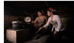
Gambar 22. Aktivitas Cooking Class