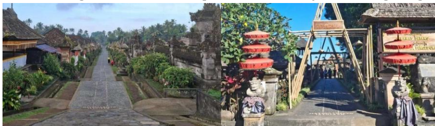
Gambar 3. Pintu Masuk Utara Ke Selatan, Pintu Masuk Tengah

Secara administratif dan sosial, desa ini lebih tepat dipahami sebagai banjar atau kampung adat, meskipun status resminya sebagai desa wisata membuat istilah “Desa Penglipuran” umum digunakan. Tata ruang permukiman mengikuti prinsip tradisional Bali dengan pemisahan jelas antara area suci (utama mandala), permukiman (madya mandala), dan area pendukung seperti pertanian dan hutan (nista mandala), yang memastikan keseimbangan antara kehidupan sosial, budaya, dan lingkungan.