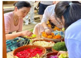
Gambar 16. Aktivitas Menganyam Canang Sari