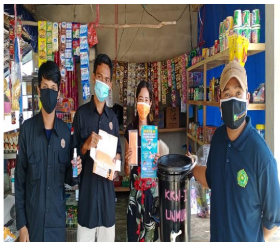
Gambar 2. Kegiatan Penyediaan Sarana Pencegahan Covid-19

Program kegiatan pengabdian kepada masyarakat dalam bentuk pemanfaatan sumber daya alam dengan fokus mengoptimalkan kesiapan desa kelubi sebagai desa wisata pasca pandemic covid-19, dengan mengelola sumber daya alam menjadi objek wisata. Program ini adalah program yang berfokus pada pengoptimalan objek wisata di kawasan hutan lindung desa Kelubi. Keterlibatan masyarakat desa kelubi sangat dibutuhkan dalam menunjang kesiapan desa kelubi menjadi desa wisata, seperti ikut andil dalam mendukung pembangunan objek wisata.