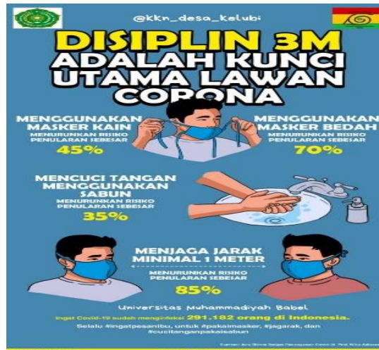
Gambar 3. Brosur Sarana Pencegahan Covid-19

Pada tahun ini mahasiswa Kuliah Kerja Nyata (KKN) ikut berpartisipasi dalam pengelolaan objek wisata Batu Begalang yang bertempat pada salah satu pos pendakian bukit. Adapun kegiatan yang dilakukan seperti membangun rumah bobbit, ayunan, plang, spot foto, tempat istirahat, dan sarana pencegahan covid-19.