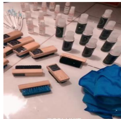
Gambar 6. Proses Packing