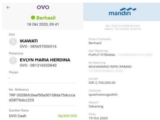
Gambar 5. Transaksi Pembayaran

Jika menggunakan layanan pengiriman yang menyediakan nomor pelacakan, berikan nomor tersebut kepada pelanggan. Ini akan memungkinkan mereka untuk melacak status pengiriman dan mengetahui perkiraan waktu tiba paket. Selama proses pengiriman, pastikan untuk tetap berkomunikasi dengan pelanggan. Berikan pembaruan tentang status pengiriman atau jika terjadi kendala atau keterlambatan. Ini akan membantu menjaga kepercayaan pelanggan dan memberikan pengalaman positif. Setelah paket tiba di tujuan, mintalah pelanggan untuk mengonfirmasi penerimaan pesanan. Pastikan mereka puas dengan produk yang diterima dan layanan yang diberikan. Setelah pesanan selesai, tanyakan kepada pelanggan apakah mereka puas dengan produk dan layanan. Berikan mereka kesempatan untuk memberikan umpan balik dan evaluasi agar dapat meningkatkan kualitas layanan di masa. Untuk pembelian dilakukan dengan sistem pre order yang dimana pembeli melakukan pembayaran terlebih dahulu baru kami dapat membeli dari penjual dan mengerjakan produk tersebut lalu dapat mengirimkan ke pada pembeli, dengan proses tersebut dapat memudahkan kami untuk melakukan proses usaha dalam distribusi dan pengeluaran modal.