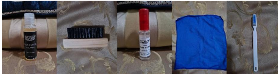
Gambar 1. Foto Produk yang belum di Re-packaging

digunakan untuk menghilangkan bau tidak sedap dan memberikan aroma segar pada sepatu setelah dicuci atau dibersihkan, pewangi ini biasanya tersedia dalam bentuk semprotan atau bola pengharum yang diletakkan di dalam sepatu; (4) Pengereng untuk sepatu digunakan untuk membantu mengeringkan sepatu secara cepat setelah dicuci atau dibersihkan, biasanya terbuat dari bahan yang cepat menyerap kelembaban dan memiliki desain yang sesuai untuk menyangga bentuk sepatu; (5) Kemasan pelindung berfungsi untuk melindungi sepatu dari debu, kelembaban, dan kerusakan selama penyimpanan atau pengiriman, ini dapat berupa tas atau kotak khusus yang dirancang untuk menjaga kebersihan dan kondisi sepatu.