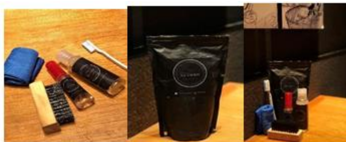
Gambar 2. Produk yang sudah di Re-packaging

Pengemasan alat-alat laundry sepatu dapat bervariasi tergantung pada produsen atau merek yang menghasilkannya. Berikut adalah beberapa contoh pengemasan yang umum digunakan: (1) Alat-alat laundry sepatu dapat dikemas dalam kotak karton yang dilengkapi dengan label, gambar, dan informasi produk. Kotak ini memberikan perlindungan fisik dan memudahkan penyimpanan serta transportasi; (2) Beberapa alat-alat laundry sepatu dapat dikemas dalam tas atau pouch khusus. Tas ini seringkali terbuat dari bahan yang tahan lama dan dilengkapi dengan penutup atau resleting untuk menjaga kebersihan dan portabilitas; (3) Blister pack adalah metode pengemasan di mana alat-alat laundry sepatu ditempatkan dalam wadah plastik transparan yang melindungi produk dan memperlihatkan isinya. Blister pack umumnya dilengkapi dengan karton belakang yang mencantumkan informasi produk; (4) Beberapa produk cair, seperti sabun pembersih atau pewangi, biasanya dikemas dalam botol atau tube. Botol atau tube ini memiliki penutup yang mudah digunakan dan memudahkan penggunaan produk; (5) Setiap alat-alat laundry sepatu harus memiliki label yang mencantumkan informasi penting, seperti merek, instruksi penggunaan, bahan yang digunakan, dan peringatan keamanan jika diperlukan. Instruksi penggunaan yang jelas dan mudah dipahami juga harus disertakan dalam kemasan.