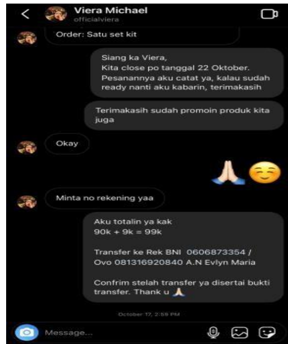
Gambar 4. Orderan Masuk di Whatapps

Jika menerima pesanan alat-alat laundry melalui WhatsApp harus ditanggapi dengan melalui WhatsApp, usahakan untuk merespons dengan cepat. Pelanggan akan menghargai respons yang cepat dan ini juga menunjukkan profesionalisme. Setelah menerima pesanan, pastikan untuk mengkonfirmasi detail pesanan dengan pelanggan. Periksa kembali produk yang dipesan, jumlahnya, dan alamat pengiriman yang benar. Hal ini penting agar tidak terjadi kesalahan dalam pengiriman barang. Sediakan pelanggan dengan informasi pembayaran yang jelas. Jelaskan metode pembayaran yang dapat diterima, seperti transfer bank atau pembayaran melalui platform pembayaran digital. Juga, berikan rincian total pembayaran termasuk harga produk, biaya pengiriman, dan detail lainnya yang relevan. Setelah pelanggan melakukan pembayaran, pastikan untuk mengkonfirmasi penerimaan pembayaran tersebut. Pastikan memeriksa dan mencocokkan jumlah yang dibayarkan dengan total pesanan. Jika ada masalah dengan pembayaran, segera hubungi pelanggan untuk memperbaikinya. Setelah pembayaran dikonfirmasi, kemaslah produk dengan baik dan siapkan untuk pengiriman. Pastikan menggunakan bahan kemasan yang sesuai untuk melindungi alat-alat laundry sepatu dari kerusakan selama proses pengiriman. Jangan lupa mencantumkan alamat pengiriman yang benar sesuai dengan permintaan pelanggan.