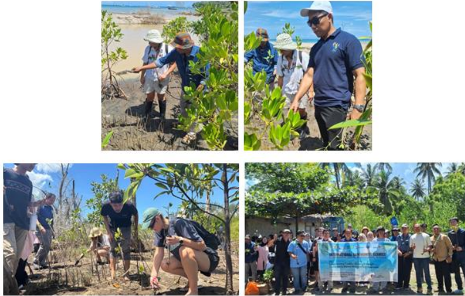
Gambar 4. Kegiatan Pengabdian Kepada Masyarakat

Pokdarwis Pantai Tembobor, serta masyarakat setempat. Kegiatan ini dilaksanakan pada kawasan mangrove yang berada di sekitar Pantai Tembobor sebagai bentuk dukungan terhadap upaya konservasi ekosistem pesisir. Kegiatan penanaman mangrove menjadi media pembelajaran yang efektif bagi peserta untuk memahami fungsi ekologis mangrove dalam mencegah abrasi, menjaga kualitas lingkungan pesisir, menyediakan habitat bagi berbagai biota, serta berkontribusi dalam penyerapan karbon. Selain menghasilkan manfaat ekologis secara langsung, kegiatan ini juga memperkuat hubungan antara akademisi internasional dan masyarakat lokal melalui pertukaran pengetahuan mengenai praktik konservasi dan pengelolaan sumber daya pesisir.