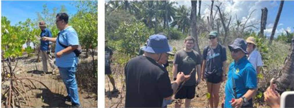
Gambar 2. Diskusi Partisipatif

Secara keseluruhan, tahap diskusi partisipatif berhasil meningkatkan pemahaman masyarakat mengenai peluang pengembangan produk wisata berbasis konservasi serta memperkuat komitmen para pemangku kepentingan untuk mengembangkan kawasan mangrove sebagai bagian dari strategi diversifikasi produk wisata di Pantai Tembobor. Hasil diskusi ini selanjutnya menjadi dasar dalam penyusunan paket wisata, materi interpretasi lingkungan, serta strategi branding dan promosi yang dikembangkan pada tahap pengembangan produk.