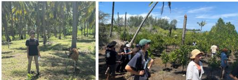
Gambar 1. Observasi dan Analisis Situasi

Namun, hasil analisis menunjukkan adanya "gap" antara potensi dan pemanfaatan. Selama ini, aktivitas konservasi seperti pembibitan dan penanaman masih dipandang sebagai kegiatan sukarela yang terpisah dari ekosistem pariwisata. Pemetaan stakeholder menunjukkan bahwa meskipun dukungan pemerintah daerah melalui Dinas Pariwisata cukup baik, kolaborasi dengan sektor industri (biro perjalanan) masih minim. Hal ini sejalan dengan temuan Siregar et al., (2025), yang menyatakan bahwa kegagalan pengembangan ekowisata sering kali disebabkan oleh lemahnya identifikasi daya dukung dan kurangnya sinergi antar-aktor dalam rantai nilai pariwisata. Oleh karena itu, strategi pengembangan diarahkan untuk mengonversi aktivitas konservasi menjadi atraksi edukatif yang memiliki nilai ekonomi tanpa melampaui carrying capacity kawasan (Puspitaloka et al., 2025).